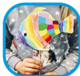
Fischstäbchen mit Botschaft · Doigts de poisson avec un message

Soudain, des vers affamés, cherchaient des restes de plastique et des méduses dansaient le ballet. Les élèves de l'école primaire étaient allés sous terre pendant deux semaines et avaient transformé les montagnes de plastique précédemment collectées en créatures sous-marines imaginaires.