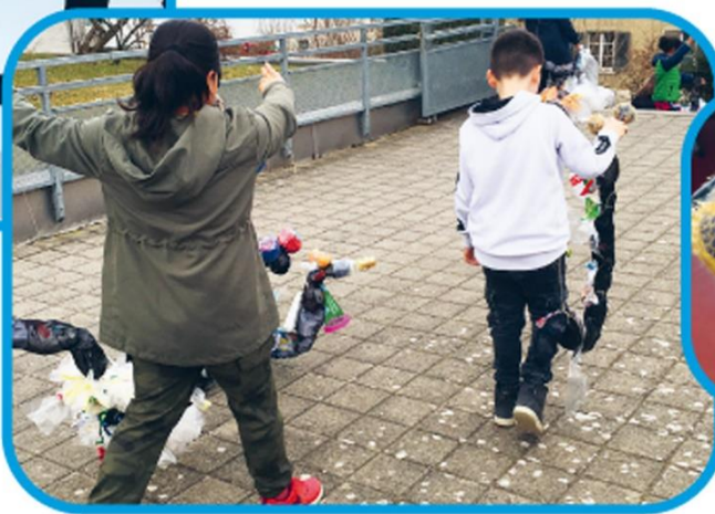
Die hungigen Würmer auf Spaziergang · Les vers affamés en promenade

1 Schulhaus 120 Kinder 4 Kunstschaffende