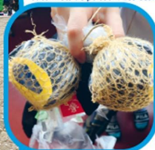
Wurmaugen · Les yeux de ver

Pendant la nuit, l'aquarium de la brillante école pouvait être vu pendant un mois. C'était la tâche des parents de se promener dans le quartier le soir pour voir les yeux des enfants ainsi que l'école.