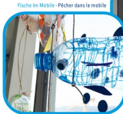
Fische im Mobile · Pêcher dans le mobile